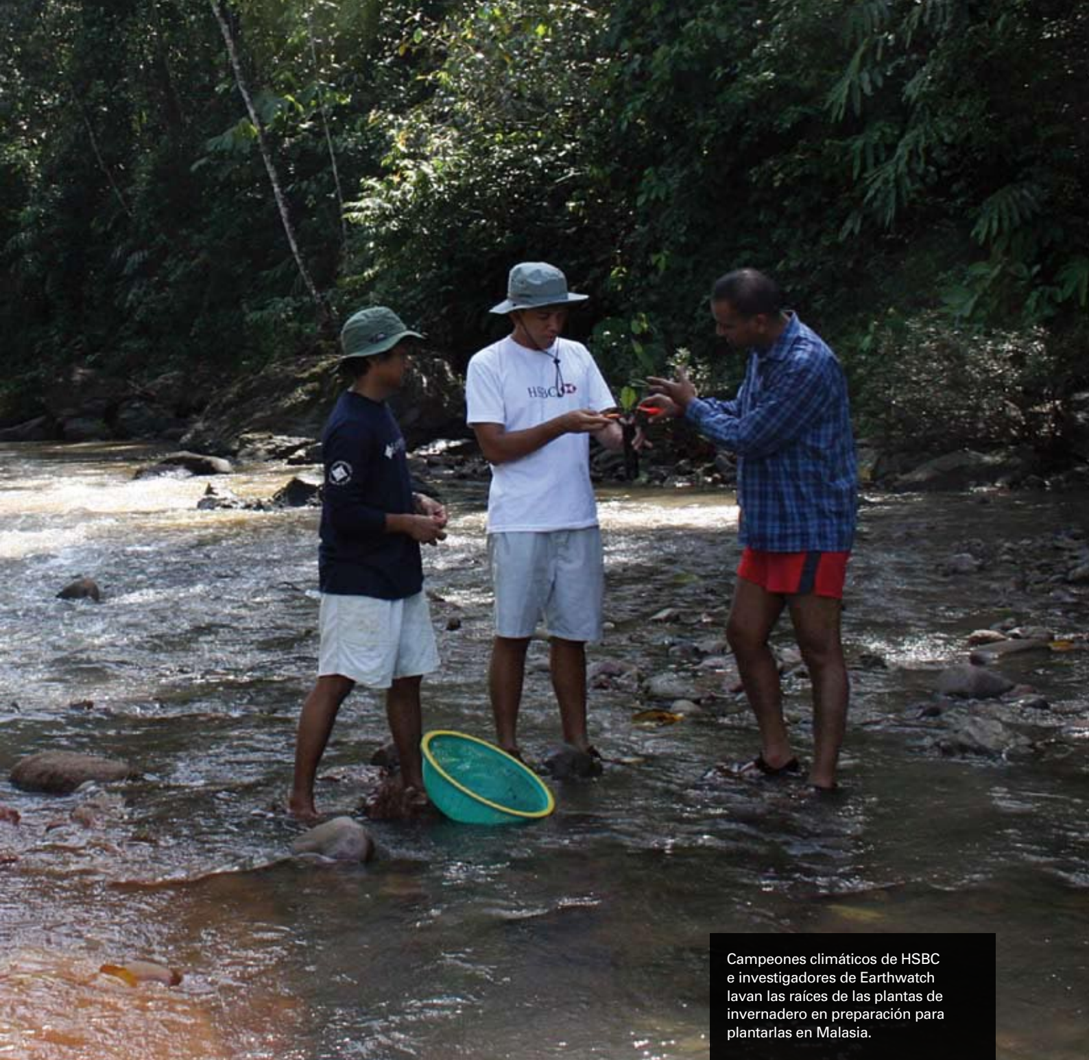
Campeones climáticos de HSBC e investigadores de Earthwatch lavan las raíces de las plantas de invernadero en preparación para plantarlas en Malasia.

permitido la reforestación de 100 hectáreas en la cuenca del Canal de Panamá con 140 mil plantas de invernadero.