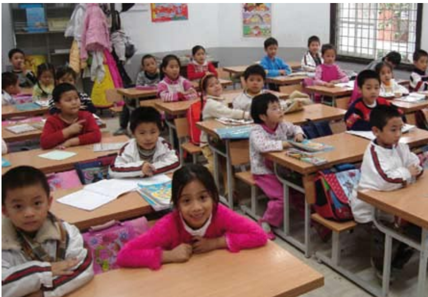
Future First ha llegado a niños en Vietnam e Indonesia.

Nuestro alcance geográfico de más de 80 países y territorios nos permite apoyar a un buen número de programas educativos globales que ayudan a reunir a personas de diferentes culturas y orígenes para que compartan su conocimiento y construyan relaciones benéficas.