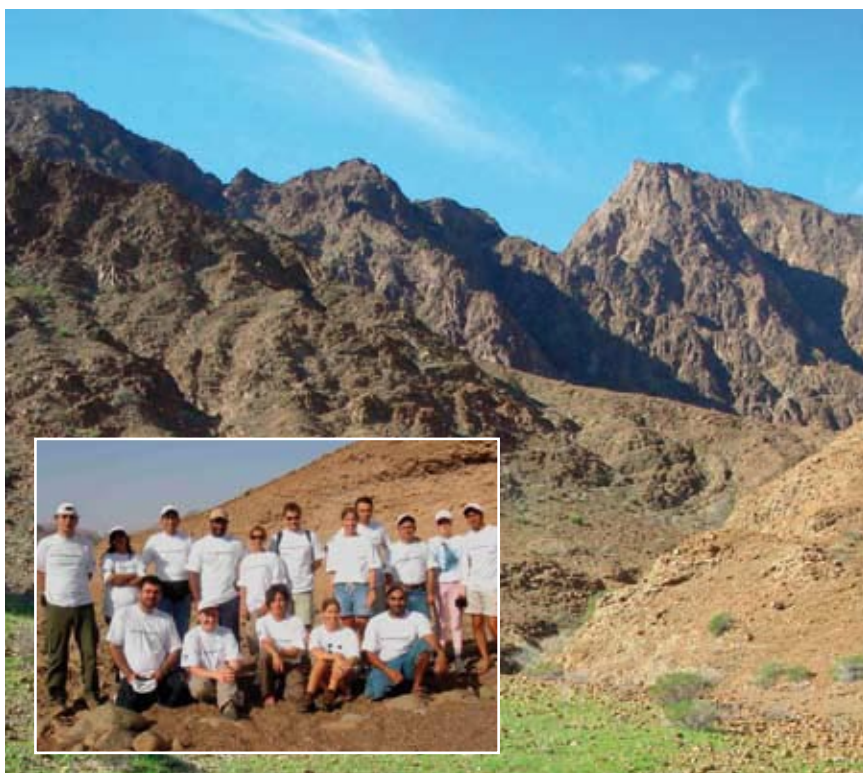
Voluntarios de HSBC en Wadi Wurayah.

HSBC está invirtiendo 10,500 dólares durante un periodo de cuatro años para mejorar la productividad de los árboles frutales y apoyar el medio de vida sustentable de los campesinos de El Salvador.