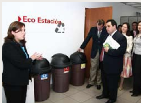
Explicación de las instalaciones de reciclaje a colegas en El Salvador.