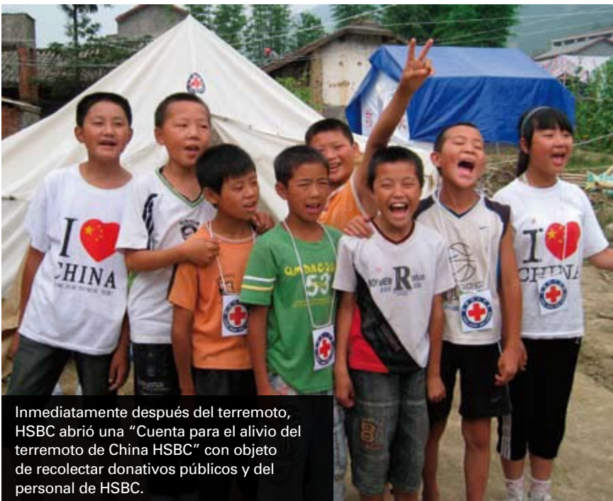
Inmediatamente después del terremoto, HSBC abrió una “Cuenta para el alivio del terremoto de China HSBC” con objeto de recolectar donativos públicos y del personal de HSBC.

Como resultado, la Cruz Roja ha podido reconstruir escuelas y hogares, así como proporcionar instalaciones de educación, equipo médico y servicios de apoyo físico y psicológico.