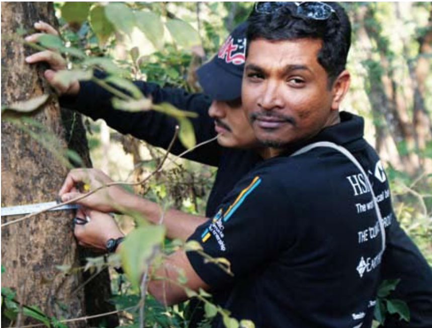
Campeones Climáticos de HSBC haciendo un estudio de los árboles en el Centro Climático Regional de la India.

Smithsonian de Investigación Tropical y WWF. Ya estamos siendo testigos de algunos logros impresionantes: The Climate Group trabaja con líderes empresariales y gubernamentales en algunas ciudades del mundo para atacar el problema del cambio climático. La participación en el Climate Partnership de HSBC ha permitido abrir nuevas oficinas y reclutar nuevos miembros en Beijing, Hong Kong y Delhi, además de lanzar la campaña Together (Juntos) en el Reino Unido, que ayuda a la reducción de dióxido de carbono en los hogares dando a conocer formas fáciles y baratas de disminuir su huella de carbono.