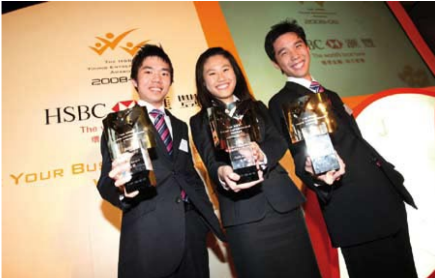
Ganadores del Final Gold Award en los premios Young Entrepreneur Awards 2008-2009 de Hong Kong, provenientes de la Universidad China de Hong Kong.